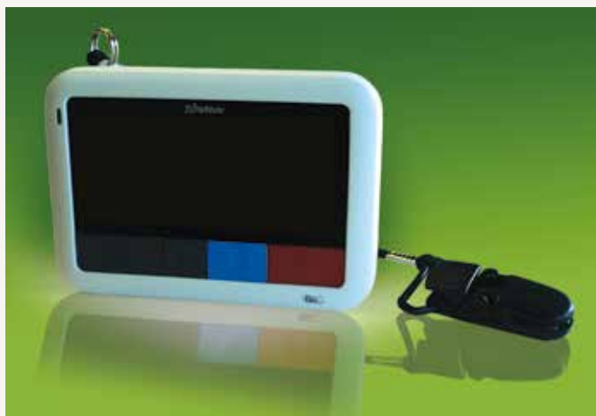
EkoTek larmsökare med två larmnivåknappar integrerad med larmmottagare.

En mycket givande investering för våra kunder.